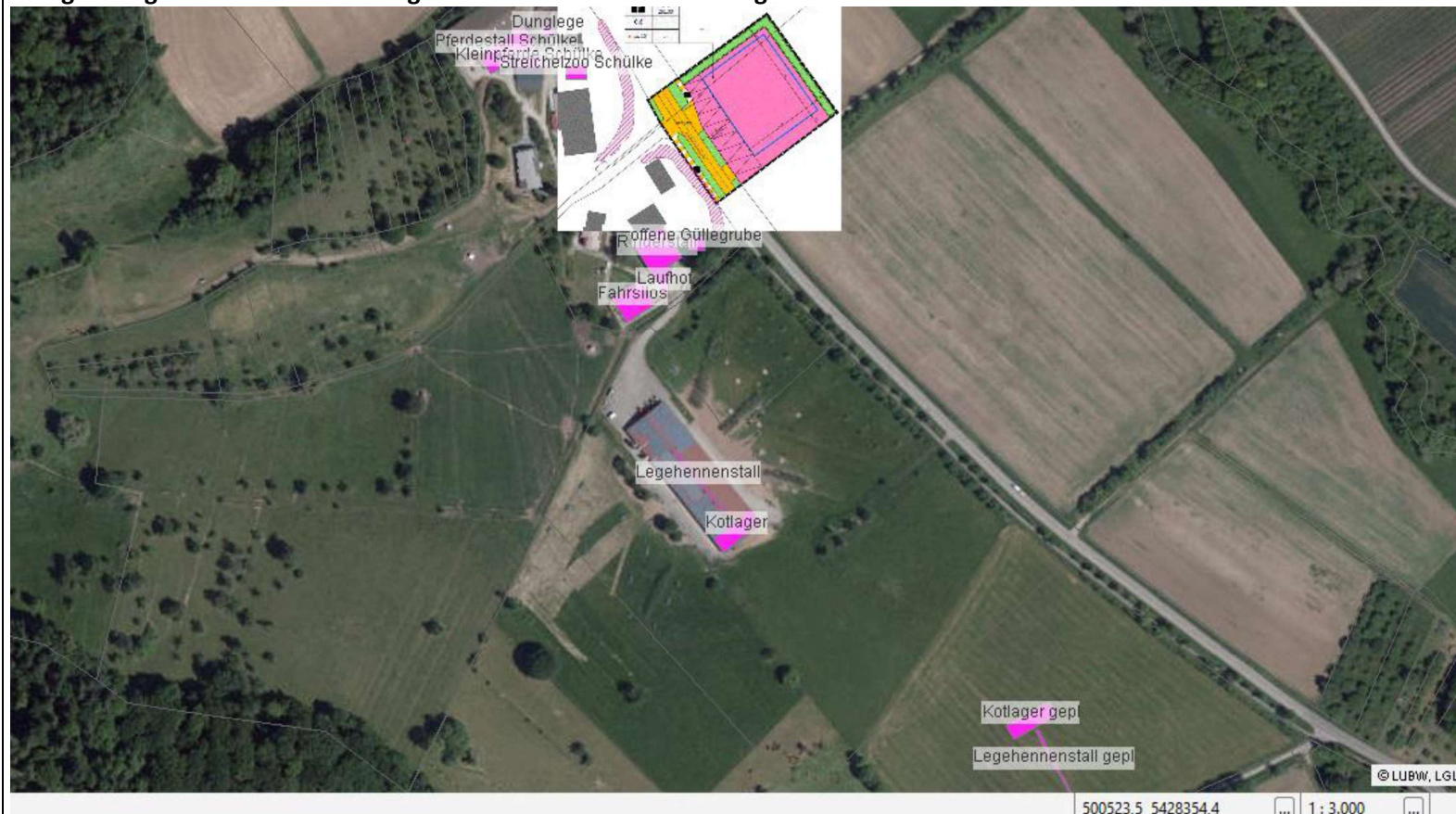
Bezeichnung der Geruchsquellen