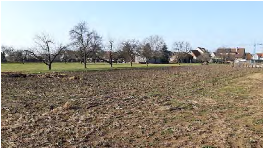
Abb. 13: Streuobstbestand auf Flst. Nr. 2485