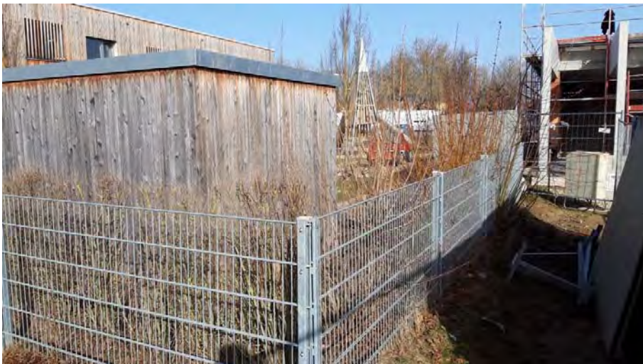
Abb. 12: Ziergehölze und niedrige Hecken entlang der Zäune