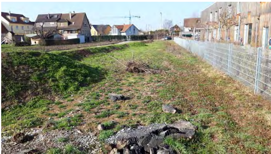
Abb. 9: Die geplante Erweiterungsfläche wird derzeit als Baustraße und Lagerfläche genutzt