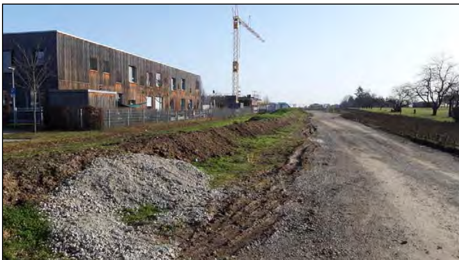
Abb. 4: Ansicht von Westen auf das Untersuchungsgebiet