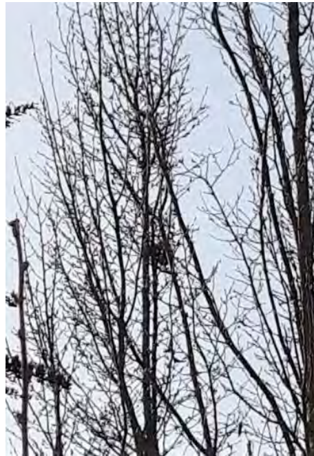
Abb. 15: Nest des Buchfinks in einem Baum in der Freifläche des Kindergartens