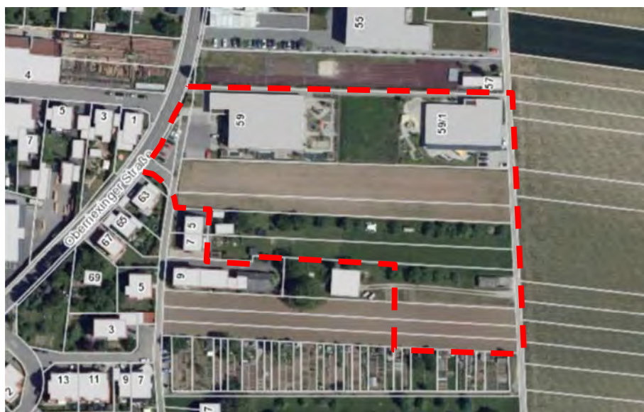
Abb. 1: Luftbild mit Abgrenzung Untersuchungsgebiet (LUBW, 2021)

Im Untersuchungsgebiet liegen Kernraum und Suchraum des Biotopverbunds mittlerer Standorte, die jedoch überwiegend überbaut sind (LUBW 2021).